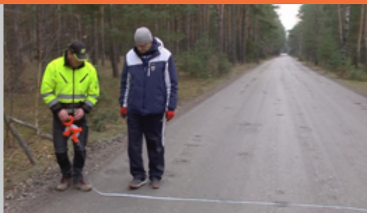
Nowe nawierzchnie dróg (...)