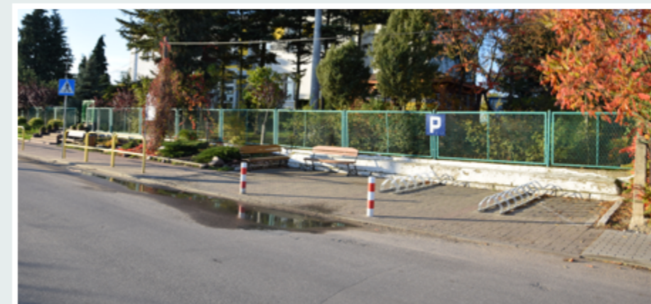
Inwestycja ze środków Funduszu Sołeckiego w Sołectwie Młyniec

Fundusz sołecki funkcjonuje w Polsce od 2009 roku i patrząc na coraz większe zainteresowanie z roku na rok, spełnia on oczekiwania mieszkańców gmin wiejskich. Jak podaje strona MSWiA w 2020 w 1527 z 2174 gmin posiadających sołectwa, wybrano właśnie ten rodzaj budżetu partycypacyjnego. Gmina Obrowo należy do wyraźnej mniejszości w Polsce. W naszej gminie nie ustanowiono jeszcze funduszu sołeckiego. Dlaczego inni zdecydowali się na takie rozwiązanie i co traci na jej braku Gmina Obrowo? Odpowiedź jest prosta. Sołectwa są bliżej ludzi niż gminy i często lepiej orientują się w potrzebach swoich mieszkańców. Środki pieniężne, którymi mogą dysponować w ramach wspomnianego funduszu są więc często lepiej i skuteczniej wydatkowane. Co więcej, sołectwa mogą te pienią-