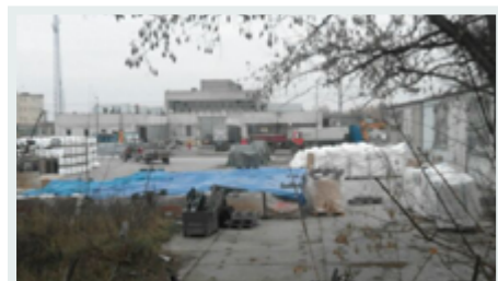
Teren, na którym ma powstać hala